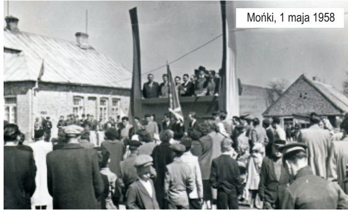
Mońki, 1 maja 1958

Impreza ta sprawiła, że w latach siedemdziesiątych i osiemdziesiątych ub. wieku, "jak grzyby po deszczu" powstawały ludowe zespoły śpiewacze. W powiecie monieckim było ich najwięcej, a cztery z nich: