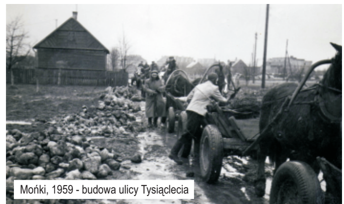
Mońki, 1959 - budowa ulicy Tysiąclecia

Wystawę zdjęć Włodzimierza Zmarzlika można obejrzeć w Monieckim Ośrodku Kultury