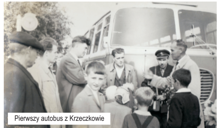
Pierwszy autobus z Krzeczkwie