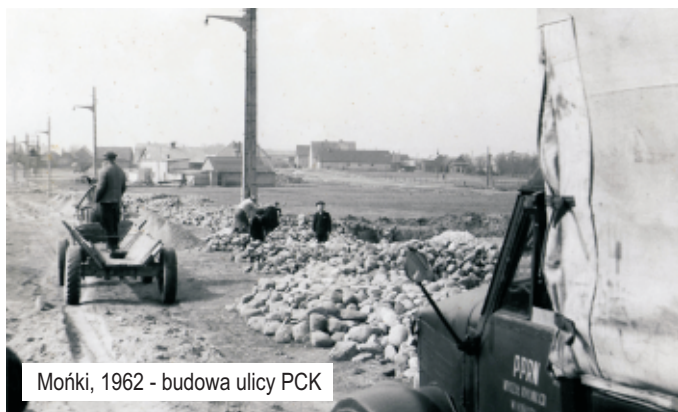
Mońki, 1962 - budowa ulicy PCK

Monieckie imprezy uświetniały znane zespoły artystyczne krajowe i zagraniczne, znani aktorzy, piosenkarze, orkiestry dęte. Odnotowano prawdziwy "najazd" dziennikarzy prasowych, radiowych i tele-